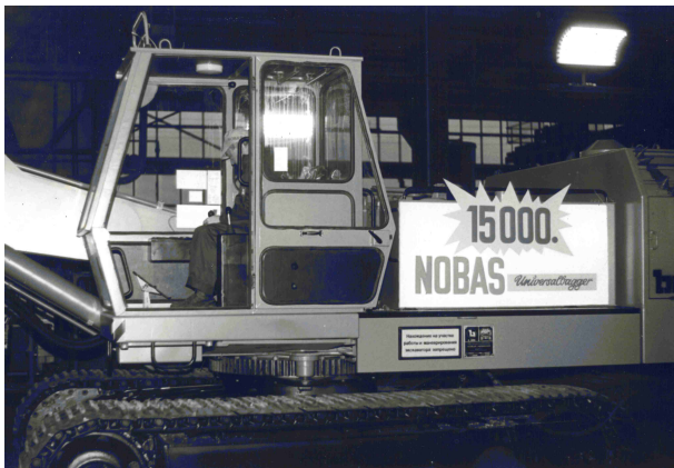
Bild (oben): Ankunft des Schriftgutes im TWA, Bild (unten): 15.000. Universalbagger von NOBAS Nordhausen

Neu im Archiv sind auch eine ganze Anzahl an Katalogen der Firma N.L. Chrestensen aus Erfurt. Die Firma übergab dem Archiv neben den Dubletten ihrer eigenen Samen- und Pflanzenkataloge von 1942 bis heute, auch Kataloge anderer Erfurter Gartenbaufirmen. Das älteste überreichte Exemplar stammt aus dem Jahr 1905 und ist von der Firma Platz & Sohn.