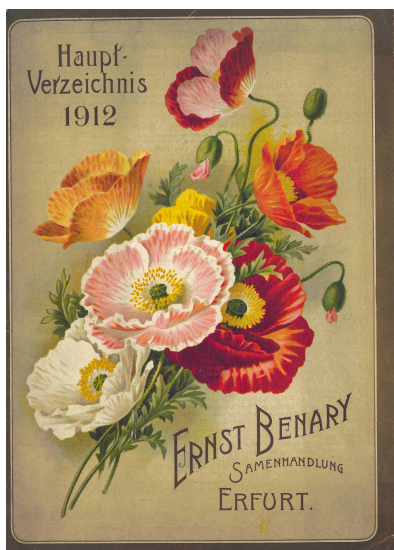
Katalog der Firma Ernst Benary, Erfurt, 1912