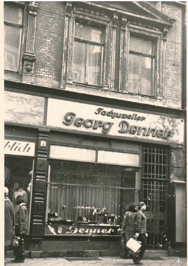
Bilder: (1-3) Werbung des Juweliers Georg Denner; (4) Postkarte mit Außenansicht eines Geschäftes in Erfurt.