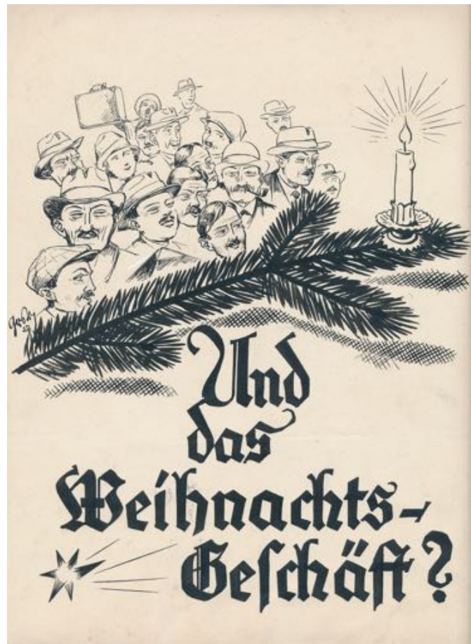
TWA N006: Nachlass R. Grasreiner, 1927 (TWA e.V.)

Jede noch so kleine Hilfe ist willkommen!