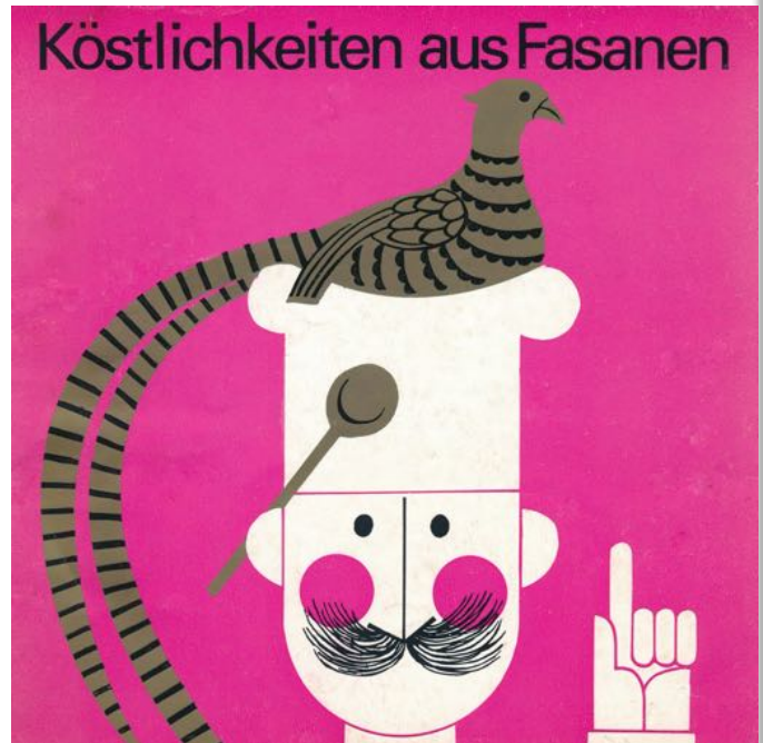
TWA S08: Das Heft „Köstlichkeiten aus Fasanen“ der LPG „Am Buchenwald“, 1974 (TWA e.V.)

Allerdings ist nicht bekannt, ob in Hottelstedt immer noch Fasane zu bekommen sind – oder ob man sich eine andere Quelle suchen muss.