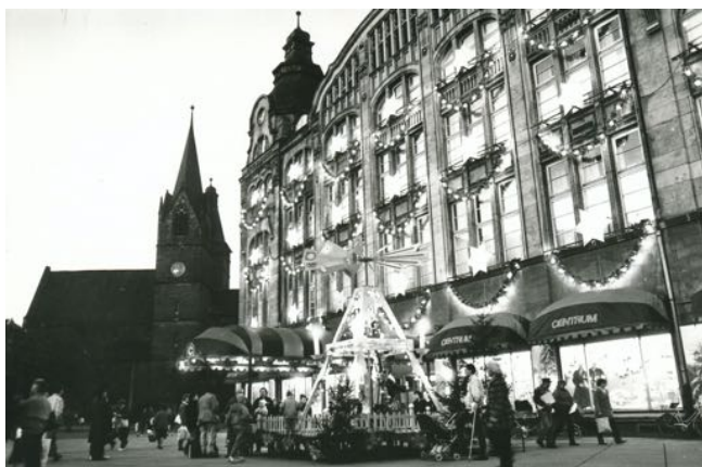
Weihnachtspyramide vor dem Erfurter Centrum Warenhaus, 1989

Unter den 22 Sammlungen des TWA befinden sich, neben Werbematerialien, Briefköpfe und Festschriften, auch eine Reihe an Fotosammlungen, Einzelfotos, Glasplatten-Fotos und Dias. Als Beispiele seien genannt die Fotosammlung des Fotografen Kurt Kalischke, die des Fotografen Dieter Demme sowie Kino-Werbe-Dias aus Arnstadt.