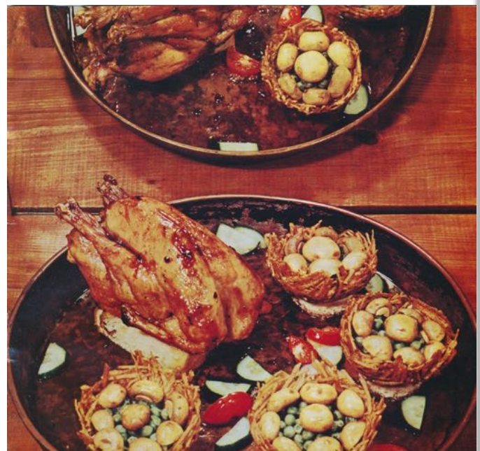
Es gibt „gegrillten Fasan mit Champignons im Kartoffelnest“, 1974 (TWA e.V.)