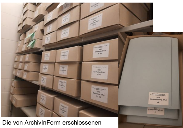
Die von ArchivInForm erschlossenen Unternehmensbestände

Bei den Beständen handelt es sich um sogenannte Treuhandbestände, d.h. Wirtschaftsbestände von Betrieben und Firmen, welche durch die Treuhand