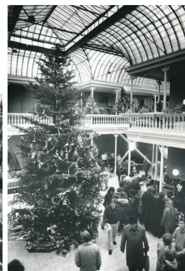
Rechts: Weihnachtsbaum im Palmenhaus, 1990