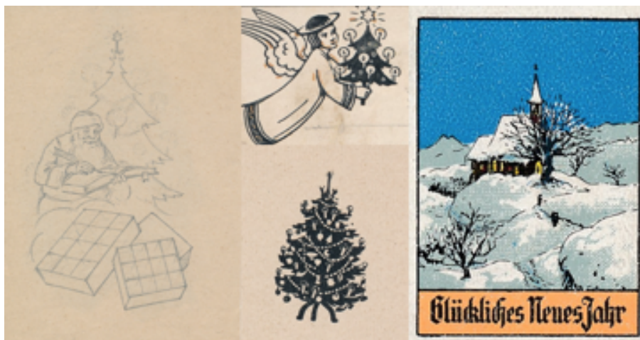
Foto 1-3: TWA N006: Nachlass R. Grasreiner & Foto 4: TWA S02-214: Reklamemarke (TWA e.V.)