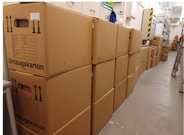
Bilder: Die von ArchivInForm zu erschließenden Unternehmensbestände „U 083 Saline Oberilm Stadtilm“