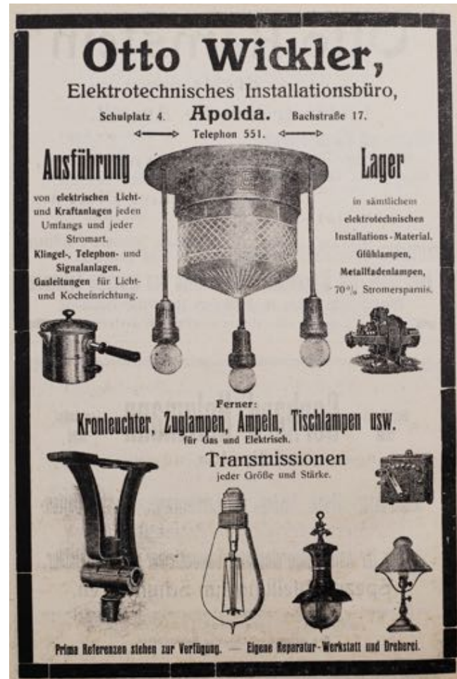
Bild oben: Werbeanzeige (1926) TWA AB-959 (TWA e.V.) Bild unten: Werbeanzeige Adressbuch Apolda Bild links: TWA U 007-42 (TWA e.V.)